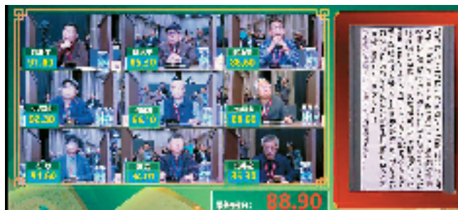
二月十日直播截图

本报讯 记者 俞越 11月2日,第二届“中国书法大厦杯”书法大奖赛在安徽合肥中国书法大厦正式开评。截至记者发稿,已开展了篆书、隶书两种书体的评审。其中,篆书特等奖空缺,27、87、29号为优秀奖候选作品;隶书127号为特等奖候选作品,90、154、174、177、173为优秀奖候选作品。最终这些作品是否获评,将依据后续面试考核结果确定。整个评审时间将长达20天。