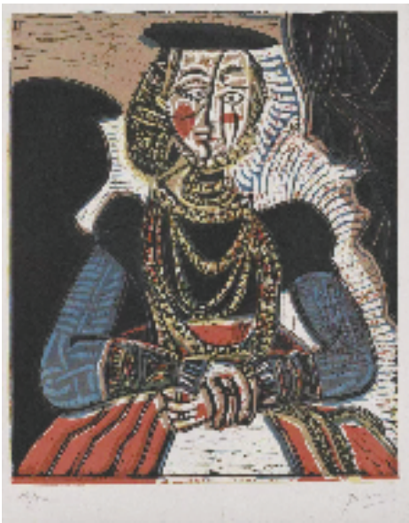
巴勃罗·毕加索 依据卢卡斯·克拉纳赫作品创作的女子肖像 27×22cm 麻胶版 1962年

杭州国家版本馆党委书记、馆长、浙江版画院理事长吴雪勇,西湖区委书记董毓民以及陈振濂等先后致辞。马锋辉为捐赠者代表童志新、赵正光颁发捐赠证书;西湖区副书记、区长周扬,浙江美术馆馆长、浙江版画院院长应金飞为“全球艺荐官”朱炳仁、夏赛丽、钱丛、