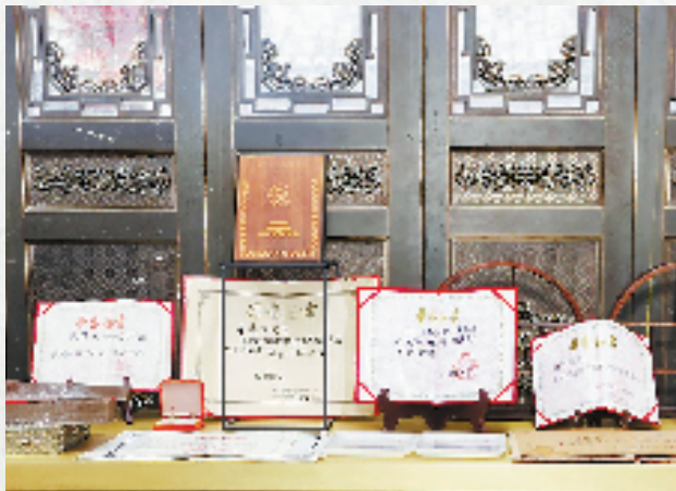
朱德源文献厅内陈列的荣誉证书