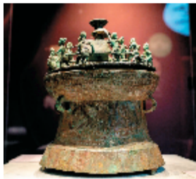
西汉·祭祀场面铜贮贝器 云南玉溪江川李家山69号墓出土

广取博采,兼容并蓄,铸就了古滇文明蓬勃的生命力。它在与其他族群的碰撞融合中,展现出了非凡的适应力与包容性,使滇国不再是云贵高原上孤立的传奇,而是与广阔世界产生了千丝万缕的联系。当历史的长河流至转弯处,一场注定改写命运的变革悄然降临。与中原汉文明的相遇与交融,即将谱下一段全新的文明史诗。据悉,展览将持续至2026年3月9日。