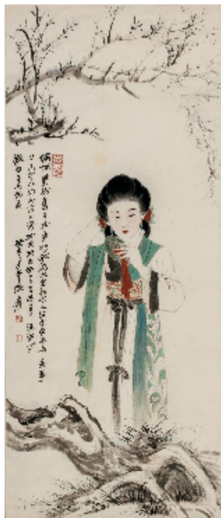
张大千 对镜梳妆图 114×49cm 人物画

清华艺博所藏多属深阁珍品,此次展览划为“东南新韵、京津新象、岭南新风、山河新貌”等板块,汇聚东南、京津、岭南诸派及中西合璧之作,勾勒前辈守护文心之精神图谱。今以崇敬之心回望百年艺脉,愿观者细味笔墨深处的文化密码,感其永不褪色之风华。据悉,展览将持续至2026年8月9日。