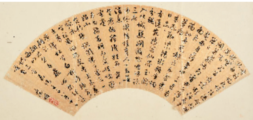
文徵明 行草书游西山诗三首 17×50cm 纸本 1552年作 广州艺术博物院藏

本报讯 艺非 11月11日,由广州艺术博物院(广州美术馆)、广东省博物馆、广西壮族自治区博物馆主办的“停云艺脉——文徵明家族书画作品展开幕”在广州艺术博物院(广州美术馆)启幕。展览共分为“风流千载”“林泉之胜”“意中乐事”“春风常在”“燕坐咏歌”五个部分,系统地呈现文氏家族十位成员文徵明、文彭、文嘉、文伯仁、文震孟、文从简、文震亨、文倬、文果(超揆)、文点的艺术成就。主办方希望通过本次展览,观众能够客观认知文氏家族在明清绘画构建过程中所发挥的重要作用,以及家族谱系在文化传承中的历史意义。展览展示文氏家族在艺术面貌、风格传承、技法演进等方面的多维图景,反映岭南对江南书画的欣赏与递藏。