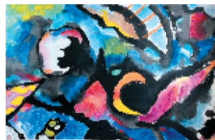
王鲁湘 彩墨五 45.5x68.5cm 纸墨丙烯

此次展出中希两国艺术家的105件精品力作。活动特别邀请雅典美术学院埃拉托·哈吉萨瓦、乔治·卡扎基斯、安东尼·迈克尔迪斯等10位希腊艺术家以及程大利、邓维东、丁宁、王鲁湘、尉晓榕、鲁晓波、林容生、何加林、张谷旻、丘挺、邵晓峰、刘海勇、周建朋、任赛14位中国艺术家、理论家参与。活动以全新文化交流形式,为中希两国文化、经济创新发展注入新活力,也是温州贯彻落实市委、市政府入境旅游发展精神、坚定文化自信、服务“一带一路”建设的具体举措,助力温州打造全新国际名片,以艺术之美构筑人类命运共同体。