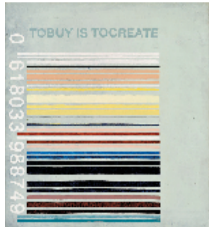
吴山专 英格-斯瓦拉·托斯朵蒂尔 编码“厨房女仆”解码买就是创造 45.5x41cm 布面油画 2011年

两位艺术家是观念艺术领域极具原创性与前瞻性的艺术家组合,他们的创作始于对语言、符号和日常生活的深刻洞察,以幽默又不失尖锐的方式,对今日盛行的消费主义、身份政治、生态环境及去人类中心主义等议题,进行了远超前于时代的思考和创作。展览以二人创作生涯中14个具有重要地位和丰富意涵的词条为叙事线索,通过1000余件相关作品与手稿,系统性地呈现二人自20世纪90年代起持续30余年的艺术