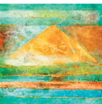
王作均 色墨流年 68x68cm 2025年

本报讯 艺非 11月15日，画家王作均个人艺术展“无色不诗”在杭州的溯美术馆正式开启。本次展览将持续至2026年3月15日，集中呈现其近10年来创作的48幅精品力作，完整梳理展示了他独创“现代色墨构成”风格的艺术蜕变之代表作，展现了这位兼具中西学养的艺术家的对中国画当代性与国际化的探索成果。