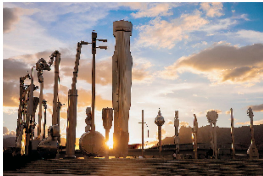
杨奇瑞 中华乐章 高9米 56件 不锈钢、激光灯 拉萨市中华文化公园 2021年

本报讯 记者 厉亦平 11月15日，“城乡艺韵·独乐众乐：首届西湖雕塑与公共艺术邀请展”在全山石艺术中心开幕。展览由浙江省文学艺术界联合会、中国美术学院联合主办，中国美术学院雕塑与公共艺术学院、全山石艺术中心、中国美术学院教师发展中心共同承办，并由浙江省文化艺术发展基金支持。