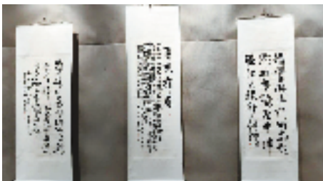
“遇见绍兴——韩国书艺术协会会员作品展”现场

本次展览共展出韩国书艺术协会会员围绕“遇见绍兴”主题创作的书法作品158幅。每一件作品都承载着韩国书法家对绍兴的深