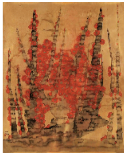
林蓝 梅坚如铁 211×171cm 中国画

展览将持续至2026年1月11日。展览开幕当日,全国画院院长座谈会召开,邀请相关画院负责同志围绕制定“十五五”艺术创作规划、加强画院管理、提升创作研究水平等议题进行座谈交流。