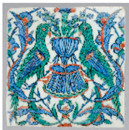
鸚鵡纹砖 土耳其 伊兹尼克 约1600年 釉陶 透明釉下化妆土上彩绘 高25.2厘米 宽24.8厘米

展览由曾打造奥赛大展“缔造现代”的法国知名设计师塞西尔·德戈(Cécile Degos)再度操刀,将广阔空间化为不断展开的空间叙事。精巧展品被重新置入