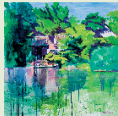
管建新 湿地深处 90x90cm