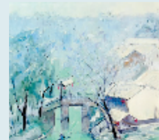
吴彩仙 冬日西溪 80x80cm