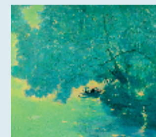
张赫 西溪摇橹 100x100cm