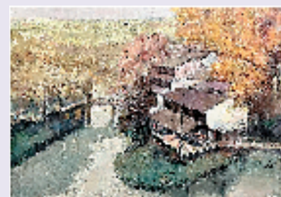
卿笑天 西溪秋瑟 50x70cm