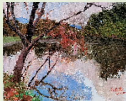
任志忠 西溪晚晴 50x60cm