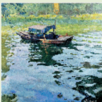
商亚东 清波 50x50cm