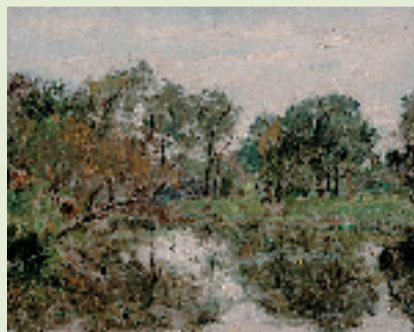
来源 溪光树影 40x50cm