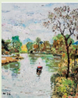
顾致农 秋景 60x50cm