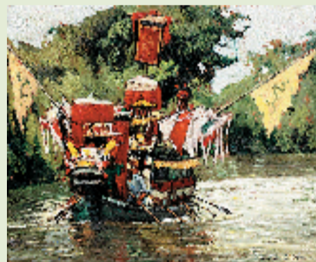
陆琦 西溪彩船竞渡 50x60cm