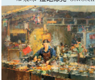
章恒威 湿地小吃街 155x180cm