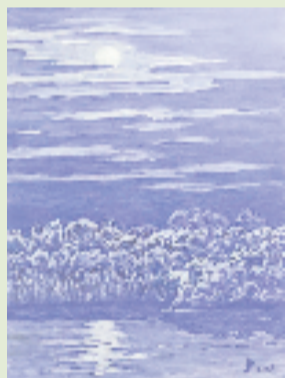
莫大林 秋雪明月 60x80cm