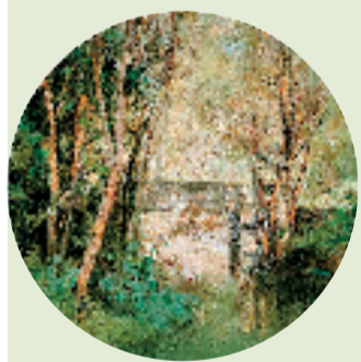
钱大勇 西溪的石桥 直径60cm