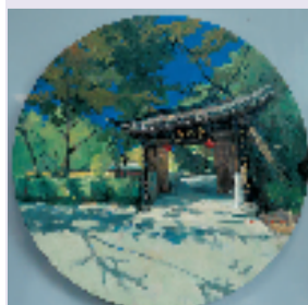
孔祥卫 檐下宁 70x70cm