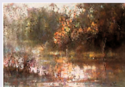
许辛 秋日光影 50x70cm