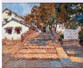
方昆 留下老街-忠义桥 40x50cm