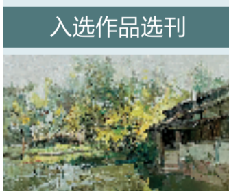
石秉琛 湿地绿光 60x80cm