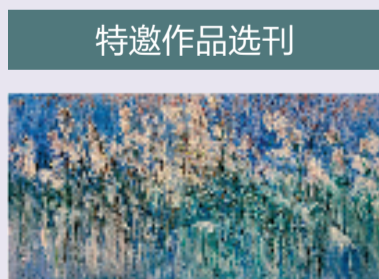
王新发 西溪芦雪 50x100cm