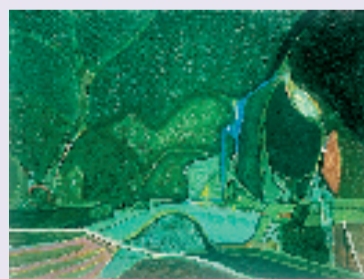
罗阳竹 西溪寻幽绿意浓 30x40cm