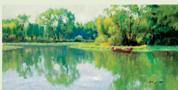
白仁海 西溪秋塘 60x120cm