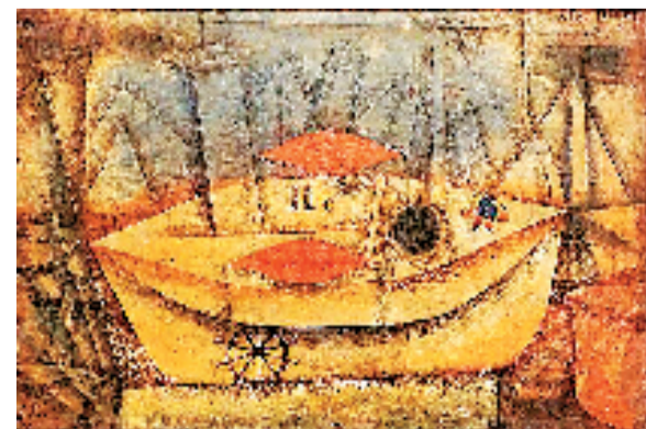
保罗·克利 港口中的Ilc号船 油画、水彩 1923年 柏林国家博物馆藏