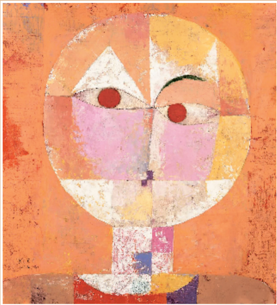
保罗·克利 千里光 油画 1922年 巴塞尔艺术博物馆藏

保罗·克利(1879—1940)是一位影响深远的现代主义画家,其作品以半透明色块、立体主义透视手法与稚拙的伪天真风格相结合而著称。他最初作为先锋表现主义团体“蓝骑士”的成员,与瓦西里·康定斯基和弗朗茨·马克一同崭露头角,随后又与康定斯基在包豪斯设计学院并肩任教。克利在表现主义风格与理论方面的教学,深深影响了众多包豪斯学子。在1940年逝世前,他成为首位在纽约现代艺术博物馆举办个展的在世欧洲艺术家,其作品亦曾于伯尔尼美术馆和巴塞尔美术馆等重要机构展出。去世后,他的画作更在全球无数顶级博物馆巡回展览,包括泰特现代美术馆、阿姆斯特丹市立博物馆、古根海姆博物馆、蓬皮杜艺术中心和斯德哥尔摩现代美术馆,并在艺术市场上屡创拍卖高价。