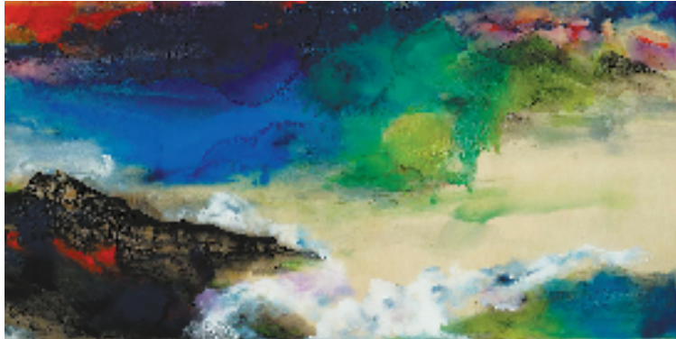
文蔚 大泽云飞 138x88cm 泼墨

策展人高世强以“周末”与“电影”的双重概念融合此展,前者象征某种与日常温柔对话的契机,后者则是一种耦合沉浸感的综合媒介。袁柳军的创作背后隐含着“建筑思维”与“山水精神”的跨界对话,通过空间的叙事性、笔墨的当代性和题材的日常性,直指当下社会的集体困境:人们对千里之外的信息如数家珍,却对附近的风景视而不见。展览将持续至2026年1月22日。