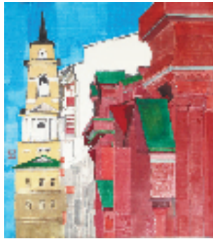
刘芳 春已至 水彩