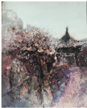
郎丽巍 咏·江南之二 水彩