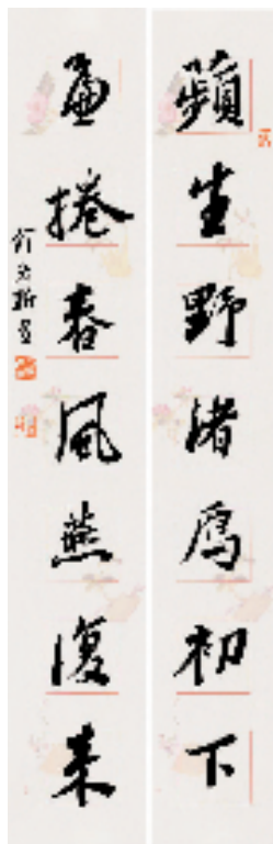
《蘋生簾卷》联句 行书