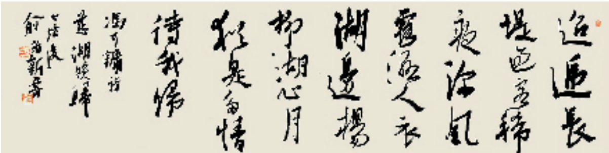
冯可镛《慈湖晚归》诗 行书