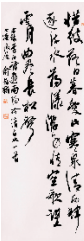
李白《游南阳冷清泉》诗 行书