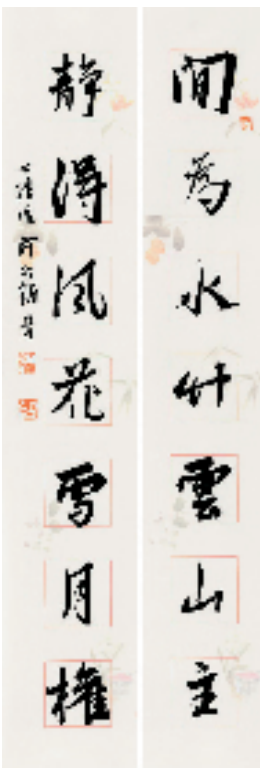
《闲为静得》联句 行书