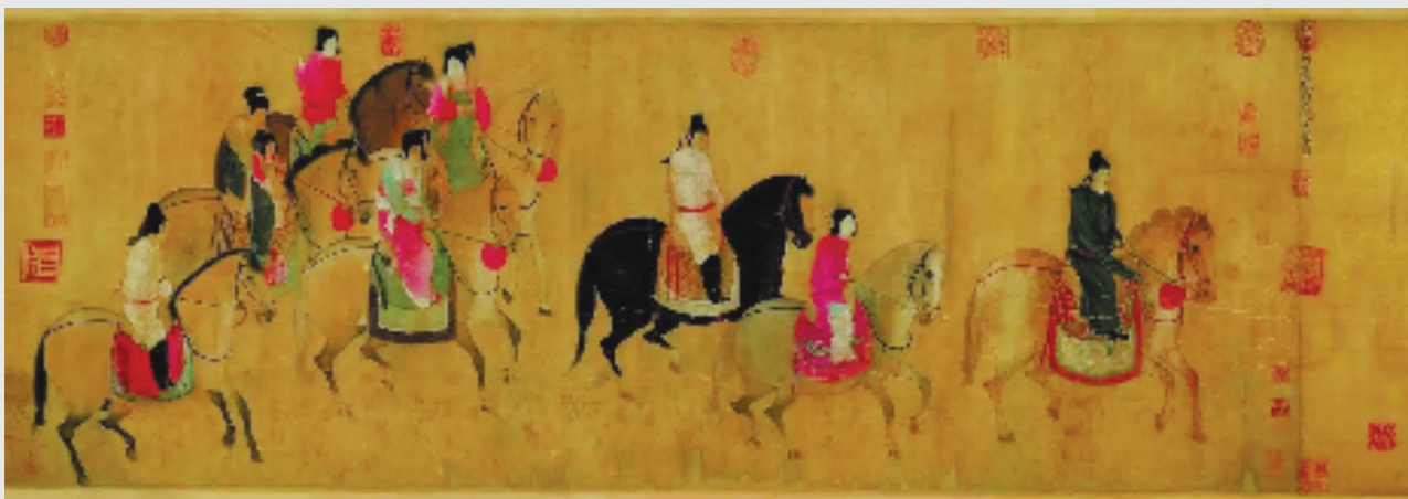
宋代摹本《虢国夫人游春图》

本报讯 通讯员 杨倩菲 由辽宁省博物馆主办,联合中国国家博物馆、上海博物馆、天津博物馆、广东省博物馆、吉林省博物院、苏州博物馆、扬州博物馆、南通博物院、沈阳故宫博物院、旅顺博物馆等国内十大文博机构共同协办的大型展览“诗画中国——中国绘画的诗意之境”近日在辽宁省博物馆正式开展。展览将持续至2026年3月29日。 展览打破传统按年代或流派陈列的模式,精心策划了“雅颂丹青”“桃园问津”“春江月明”“烟江叠嶂”“浣花诗影”“放翁清咏”“落花送春”等十余个诗意主题篇章,有机串联起不同时期、不同作者的诗画作品,呈现诗歌与绘画作为两种至美的语言,如何共同塑造中华民族观察世界、安顿心灵的方式。 本次展览共展出115件/组(210单件)