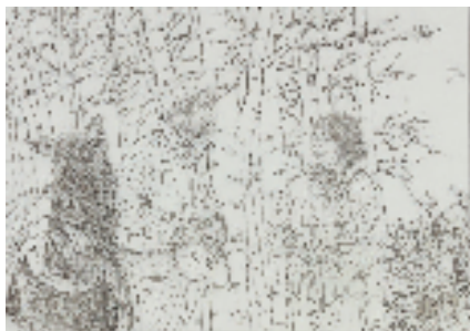
顾迎庆 姚瑶 纤手绣荒山 右玉余晓兰

本报讯 通讯员 李冰 国家艺术基金2025年度资助项目“新征程 新篇章——全国架上连环画作品巡展(鞍山站)”于1月10日在鞍山钢美术馆启幕。展览由中国美术家协会、鲁迅美术学院主办,中国美协连环画艺委会承办。 展出的作品秉承“深入生活,扎根人民”的创作原则,以连环画特有的叙事方式,描绘全国各条战线涌现的先进个人和先进集体的故事。这些作品既保留了连环画叙事性强、通俗易懂的特点,又在构图、色彩、技法上融入了更多当代艺术元素。作品紧扣“新征程 新篇章”的时代主题,生动描绘了中国人民在新时代的奋斗故事、国家发展的辉煌成就以及对美好未来的憧憬与向往。