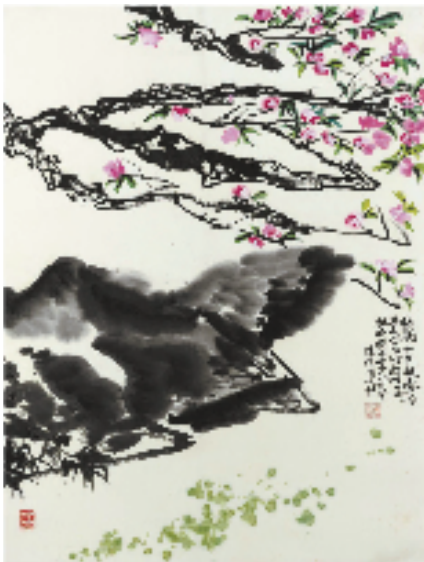
陈振濂 桃花十里映春风 92x68.5cm 书法家协会顾问、教育部高等学校美术学类专业教学指导委员会副主任委员、中国美术学院教授、博士生导师。享受国务院政府特殊津贴。

本报讯 通讯员 唐甫 1月13日—25 日,“渡象归真——王顾宇中国画作品展”在江苏艺术馆举办。展览是王顾宇近十年中国画艺术创作路径的完整呈现,通过“墨痕水韵·都市心印”与“丹青流彩·天地化境”两个板块串联起来。 在第一板块“墨痕水韵”中,“渡”体现为一种“入世的笔锋”。作者将目光投向城市,从都市景观到金陵风貌再到大国工程,试图以创新性的笔墨语言,解构并重塑钢筋水泥的森林。用水与墨在宣纸上碰撞、