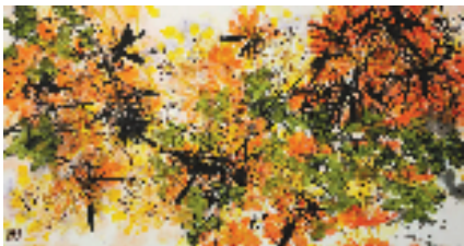
张万琪 阳光璀璨江河明 此次展出的作品中,既有其 30 多年前在上虞的写生之作,如《曹娥江上》《长塘归舟》《道墟迎春》《陈溪秋落》等,生动记录了上虞旧貌;也有抽象水墨《美国即影》系列,展现了他对光影与物象神韵的巧妙融合。

其自幼受家学及潘君诺、申石伽、应野平等名师熏陶,奠定其诗书画贯通的路径。从此次展出的作品看,陈振濂以“书画兼融”为根本,其笔下的山水花鸟不拘形似,笔墨中融贯书法的筋骨与气韵——或取草书的潇洒流转,或得籀篆的古朴沉凝。这一“以书入画”的实践,既承续了吴昌硕、潘天寿以来“以线立骨”的传统,亦融入了对线条美学的当代诠释。 开幕式上,陈振濂向西泠印社集团捐赠 3 件作品,新书《草木之心——陈振濂中国画作品集》发布。当天下午,“笔墨意涵——中国文人画的美学和精神探究”学术与创作研讨会同期举办。 展览将展至 3 月 15 日。