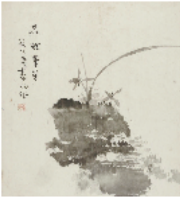
霍春阳 品雅华芳 54x50cm

展览开幕式上,天津美术学院党委副书记、院长邱志杰,中国艺术研究院院长、党委副书记周庆富,中国国家画院院长、中国美术家协会副主席刘万鸣,中国美术家协会副主席、天津市美术家协会主席贾广健,美术理论家孙克先后致辞;天津美术学院美术馆副馆长李旭飞介绍展览情况;随后,天津美术学院教授霍春阳致答谢词。开幕式由天津美术学院副院长寇疆晖主持。