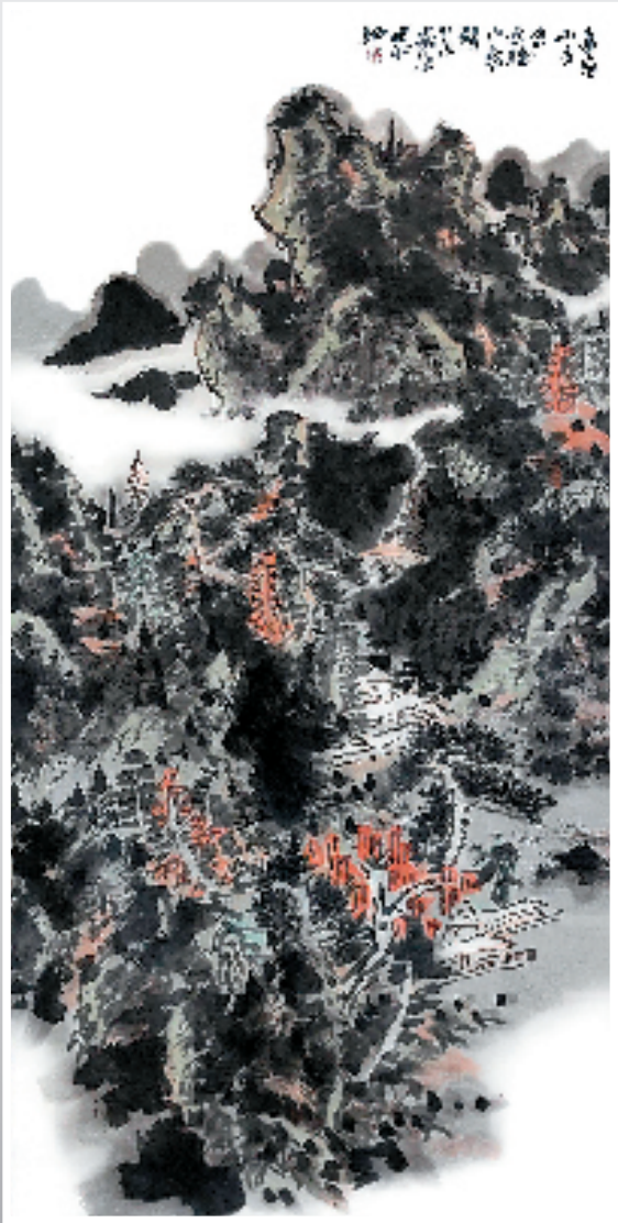
陈迪和 远看山有色 近听水无声 136×68cm