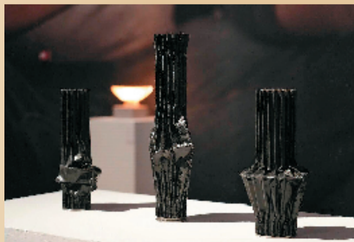
RESTUDIO 侗瓶 侗布工艺

由CraftPlus平台邀约，设计师品牌“RESTUDIO”将质地硬挺、表面有光泽的侗族亮布，制成花瓶、灯具等用品，将古老的手工艺带入更多元的生活场景。