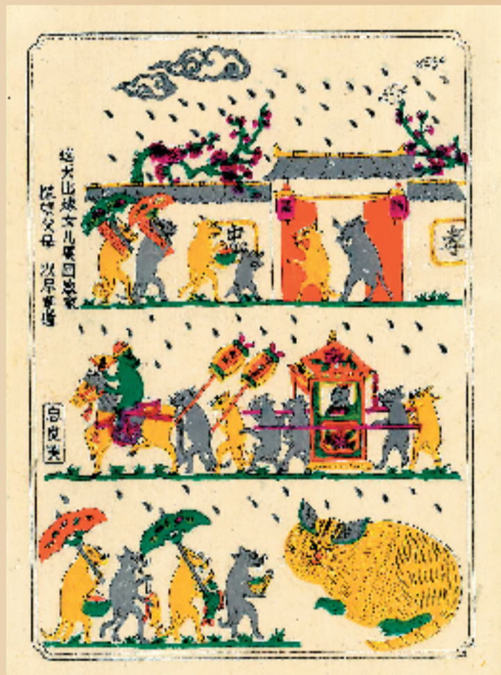
陆显中 雨水·老鼠娶亲 年画 59x39cm