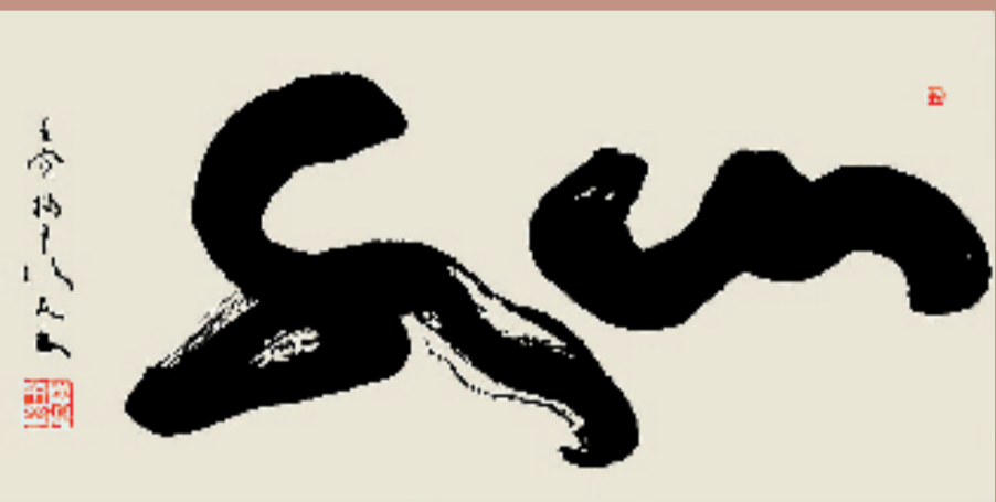
厉复友 山水 50x100cm 创作于2022年8月