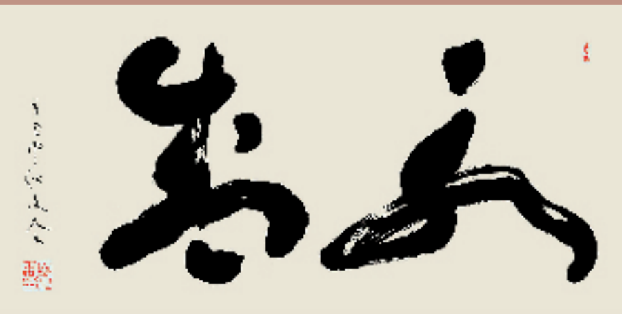
厉复友 永盛 50x100cm 创作于2021年9月