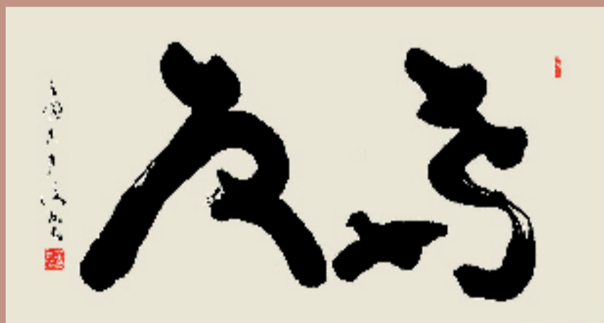
厉复友 奋发 50x100cm 创作于2022年2月