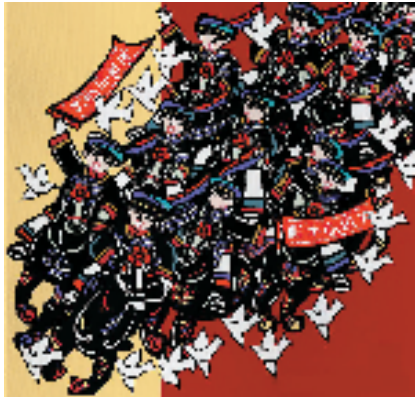
袁天兴 岳红霞(贵州) 水族端节·跑马