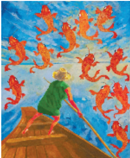
方力钧 2025 50×60cm 布面油画 2025年

“生活和工作难解难分。”艺术家在展览自述中写道。他有时延续以往作品中的图像和造型,有时则完全让海洋垃圾的材料特性引领创作方向,走向未知的艺术境地。