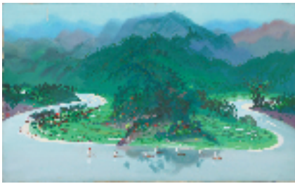
周令钊 凤凰展翅(创作小稿) 12.8×33.2cm 纸本粉彩 1963年

周令钊的艺术生涯,始终与中国近现代的历史进程同频共振:他以画笔记录社会现场,以设计参与国家建构,并以师者之心扶掖后学。其作品所承载的,不仅是个人的艺术风格,更是一代代美院先生