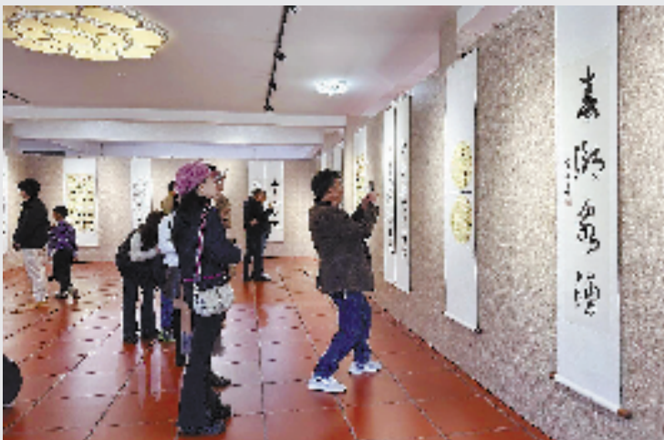
春潮泉涌——2026年泉州市迎春书法作品展

本报讯 浙青书 1月29日，“福韵新章”浙江省青年书法家协会创作委员会走进千岛湖春联书法作品展，在淳安县梓桐镇梓桐艺术馆温情启幕。本次活动由浙江省青年书法家协会创作委员会、淳安县文联、梓桐镇人民政府、淳安县老年书画研究会联合主办，展览持续一个月。此次展览是浙江省青年书法家协会创作委员会“书法艺术贴近生活、服务人民”的生动实践，吸引了当地书法爱好者与村民共赴这场墨香四溢的文化盛宴。 此次展览汇集了浙江省内青年书法家的50余幅春联佳作，涵盖篆、隶、楷、行、草诸体，既有“春风入喜财入户”的祥和暖意，也有“千门万户曈曈日”的家国情怀，希望通过笔墨传递温暖，让传统文