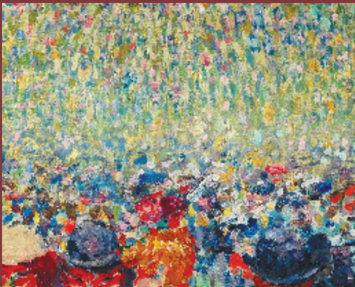
基斯·凡·东根 加莱特磨坊 布面油画 约1906年

在《戴头纱的西班牙女子》中，人们可以感受到凡·东根在接触到明媚的阳光和令人陶醉的西班牙文化时所受到的深深震撼。他的野兽派风格不仅在这里得到了更新，更扎根于新的现实之中。画中模特的脸庞性感而骄傲，浓妆艳抹的脸颊和嘴唇、深邃而锐利的目光，以及突出的颧骨投下的深邃阴影，都对观者产生了强烈的吸引力。这位西班牙舞者外表性感迷人，却又被面纱和扇子遮掩，显得既热情奔放又羞涩内敛，令人心生无限遐想。她所散发出的魅力，正是凡·东根力图展现的效果——正如他自己所说：“我喜欢一切闪闪发光的东西，闪耀的宝石，闪烁的织物，以及能激起情欲的美丽女人……绘画让我能够最充分地拥有这一切，因为我所描绘的往往是萦绕心头的梦境或执念的升华……”