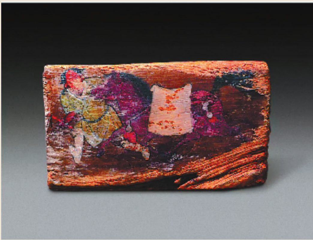
西夏 彩绘牵马大六木板画 武威西夏博物馆藏

马,既是驰骋疆场的勇士伙伴,也是艺术长河中永恒的灵感符号。版画以刀代笔、以版为媒,将马的雄健、灵动与风骨定格在纸张之上,跨越时空与地域,留下了无数经典之作。