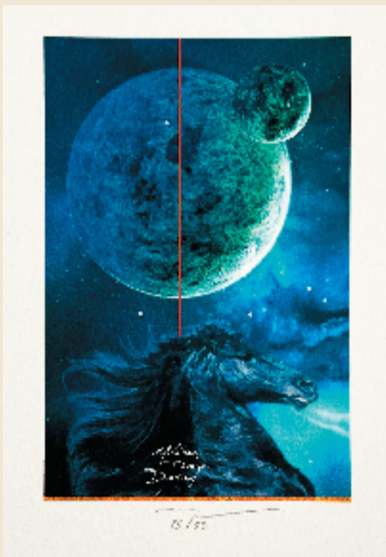
马丁·R·巴廷斯(比利时) 丙午年 14.5×6cm C.G.D(计算机设计) 2026年