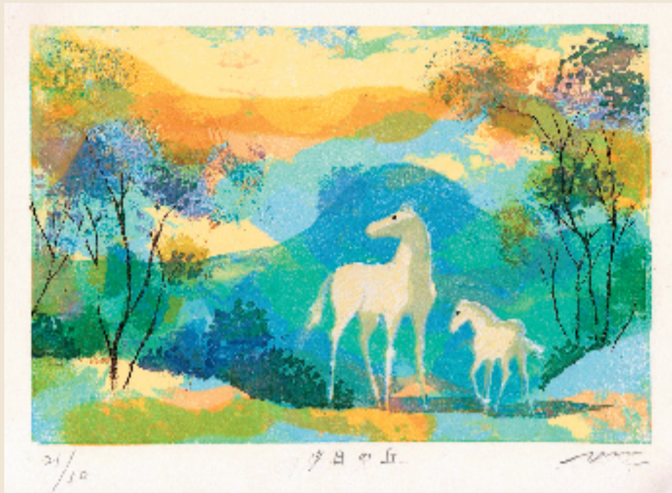
见代博子(日本) 日落山 15×22cm 孔版