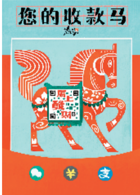
甘峰(慕容引刀) 您的收款马

这匹从传统奔向当代的漫画马，既是陪伴我们抒发情绪的同行者，也是传统美术创新发展的实践者——当艺术贴近真实情绪、扎根现实土壤，就能打破所有圈层，成为连接人心最温暖的精神纽带。