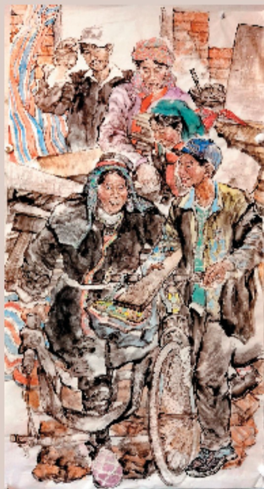
阳帆 建新房 180×90cm 2023年