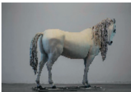
向京 异境——这个世界会好吗? 215x265x120cm 铸铜着色 2011年

此次展览以“驿”为展览的空间意象，分为“梦·入境”“途·传轍”“驿·启封”三个篇章。第一章“梦·入境”展现艺术家以笔墨筑梦，引领观者入画中之境；第二章“途·传轍”展现创作者以笔锋书写时代抱负，在墨色浓淡间寄托对时代的理想；第三章“驿·启封”，每一幅画作都承载着历史记忆，工笔写意间蕴藏深沉思索。每一件展品都是一封跨越时空的“信”，而“马”便是承载千年文脉的文化信使。观众可化身“驿丞”，在移步换景中，逐一“拆阅”笔墨间的心意，开启一场从内心梦境出发、穿越现实烟火、抵达历史记忆的文化之旅。