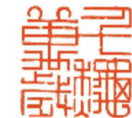
内容: 千秋万岁 尺寸: 2.5 × 2.5 cm 作者: 张宏图 洛阳市图书馆馆长 洛阳市书协主席