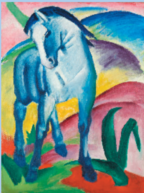
弗朗茨·马克 蓝马一号 1911年

度。1910年底,他正式提出色彩理论:“蓝色代表男性原则,内敛而富有灵性;黄色代表女性原则,温柔、快乐而感性;红色代表物质,粗暴而沉重,总是被其他两种颜色所对抗和超越。”