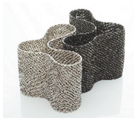
吕特·拉莱曼（比利时）三角 黑 32x18.5cm 白 27x19cm 陶瓷

本报讯 通讯员 德琪 2026年是中国与比利时王国建交55周年，作为“中比文化艺术交流年”系列活动之一，“象外——比利时当代艺术杭州特展”于3月26日在杭州英蓝中心启幕。本次展览亦是浙江省与西弗兰德省友好省份文化交流的重要篇章。