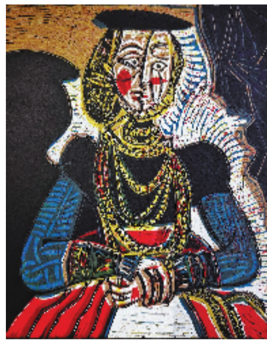
毕加索绘制（1958年）印制（1962年） 女士肖像——致敬小克拉纳赫 25x18cm 胶麻版画

本报讯 通讯员 艺非 3月24日至4月24日，“欧洲版画500年——16—20世纪欧洲版画艺术脉象”展览在湖北省美术学院美术馆展出。本次展览由湖北省文化和旅游厅指导、湖北省美术学院主办、湖北省美术学院美术馆承办，系2026年湖北文旅“百优”项目、“十大美术展览”及“引展入鄂”重点项目。