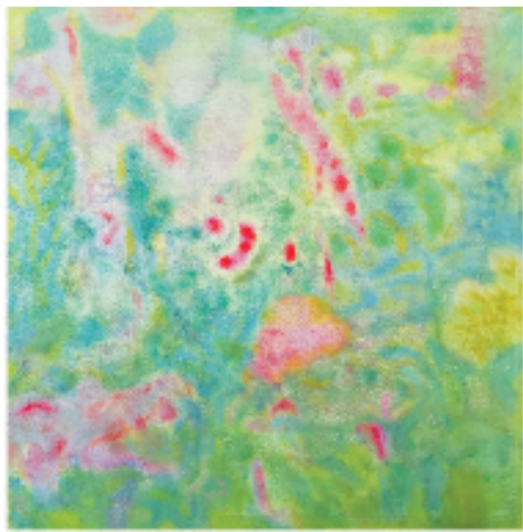
李新月 春韵 80×80cm 油画 2025年