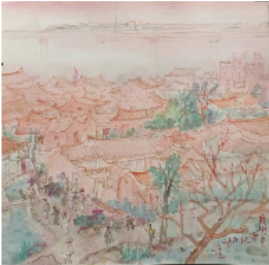
丘挺 泉州晋江梧林古村 38×38cm 2025年

丘挺，1971年生于广东，先后于中国美术学院国画系获本科及硕士学位，清华大学美术学院获博士学位。现为中央美术学院教授、中国画学院院长。