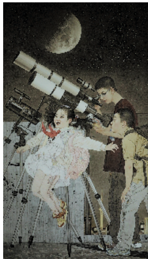
桑建国、刘莹莹 追梦 中国画