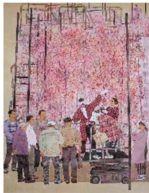
曹培芹 小岗逐梦人系列之智能农业园 中国画