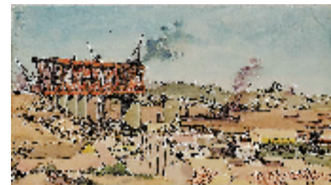
严云开 正在建设的长江大桥 16.7×29.3cm 纸上水彩 1956年9月 湖北美术馆藏

本报讯 通讯员 胡美文 3月28日,文化和旅游部2025年全国美术馆青年策展人扶持计划入选项目:时间的刻度——《最后一根钢梁》及武汉长江大桥主题作品研究展在湖北美术馆开展。