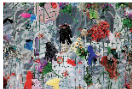
方力钧“海洋垃圾”系列

本报讯 通讯员 德琪 3月29日至9月6日，苏州工业园区公共文化中心主办的“大浪淘金·方力钧艺术展”在苏州金鸡湖美术馆展出。展览由杜曦云与刘木维联合策展，以宏大的叙事视角，系统梳理了中国当代艺术领军人物方力钧四十余载的创作脉络。这是一部以画笔书写的时代精神档案，一次个体生命与历史洪流深度共振的学术呈现。