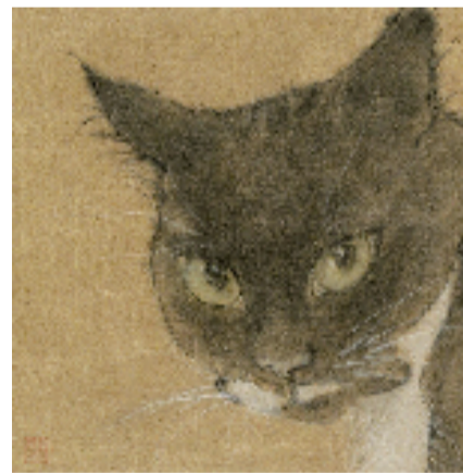
谢雯 凝眸 水墨画

本报讯 通讯员 晓峰 3月30日，“万物静默如谜——谢雯水墨作品展”在杭州莫干山路的艺术西湖·家开幕。