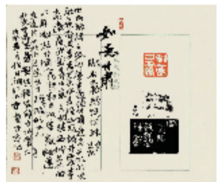
童定家 如意甘肃 2.5x2.5cm

此次甘肃地名篆刻展,分为省会名城、河西故郡、东南形胜、中南毓秀等四个单元内容进行展示,共计涉及70余个地名,80余件展品,涵盖了甘肃大部分地区,在甘肃、在兰州的历史上尚属首次。它是甘肃地名展览集大成者,也是甘肃特色地名的生动诠释和有情书写。展出精品在印面表现上以历代经典印风为基调,在文字应用上包含甲骨文、金文、秦篆、汉篆、小篆及草书等书体,既有大刀阔斧的写意印风,也有温润娟秀的工稳表达。在边款创作上更加