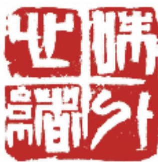
韩天衡 味外心绪 篆刻

11.25米的《荔枝诗卷》,甄选自唐至明清17位名家吟咏岭南荔枝的经典诗作,以笔墨镌刻岭南风土人情,让千年粤韵在书法中流转;书法作品《广州花市》则源自陈毅元帅的同名五言诗,以遒劲笔墨勾勒羊城花市的繁盛景象,映照出社会主义新时代的生活芳华,更饱含着艺术家对岭南大地的深情厚谊。