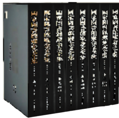
●《国家图书馆藏金文全集》 ●曹锦炎/主编 ●浙江人民美术出版社/出版

《中国历代绘画大系》由浙江大学、浙江省文物局编纂,浙江大学出版社出版,这一项目被称为迄今为止同类出版物中精品佳作收录最全、图像记录最真、印制质量最精、出版规模最大的中国绘画图像文献。该书收录全球263家文博机构的中国绘画藏品12405件(套),涵盖《先秦汉唐画全集》《宋画全集》《元画全集》等系列,共计60卷226册。