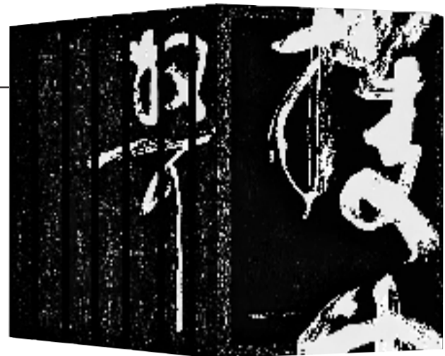
●《林散之全集》 ●王冬龄 黄啸/主编 ●湖南美术出版社/出版

该书是国内以图像学方法系统研究中唐吐蕃时期敦煌艺术的开创性学术著作,全书约50万字,配400余幅珍贵图片,编纂团队对文稿与图片进行细致校核、精心编排。从学术表述的精准把控,到洞窟线描图、壁画实拍图的图文互证设计,再到三编内容的逻辑梳理,始终坚守学术严谨性,让研究成果的呈现既系统完整,又高度贴合专业学术阅读与研究需求,为敦煌艺术研究打开全新历史切面。