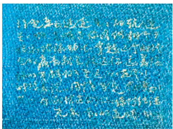
鲁大东 尼采《星星的道德》67x54cm