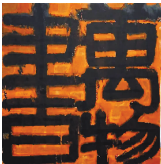
张爱国 万物书 120x124cm