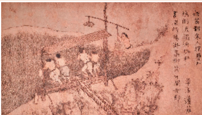
元代 佚名 耕稼图(局部) 美国大都会博物馆收藏

画家刘文西年轻时就从杭州来到了陕西,扎根陕西,深入生活,创作了歌颂毛主席和陕北农民的大量作品。