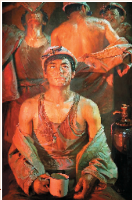
▶ 广廷勃 钢水、汗水(油画)

作者罗中立曾在农村插队十年,他是在见证了一个个农民的人生历程后创作的,为此他酝酿了很长时间,1981年,终于以当时照相写实主义的手法完成了此作,轰动了整个画坛。