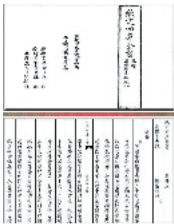
元代虞集所著 道园学古录

谁画参天铁石柯,凤毛春暖锦婆娑。玉堂妙笔交游尽,六合无尘水绝波。老可当年每画之,满堂宾客动秋思。苍龙过雨影在壁,别出参差玉一枝。【元代虞集诗句,虞集,字道园,元代文学家,祖上为南宋将领,写《道园集》,如图】