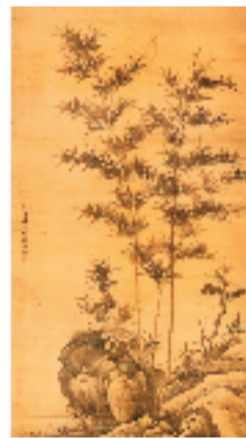
元朝 李士行 竹石图

《墨竹图》在清代正式进入宫廷,收藏于紫禁城。画幅上钤有嘉庆、宣统两朝内府鉴藏印,证明其曾被收入紫禁城或圆明园收藏。20世纪30年代,为躲避战火,故宫文物启动大规模南迁。据《瀑乡安顺·温泉康养之城》一文记载,抗战期间,部分故宫书画珍品曾藏于贵州安顺华严洞里,其中即包括文同《墨竹图》。这一大批文物经四川、贵州、南京等地辗转,最终于1949年随国民党迁往台湾省,由台北接收并重新整理编目,自此定藏于台北故宫博物院。