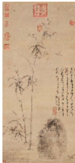
元代 吴镇 竹石图 台北故宫博物院藏