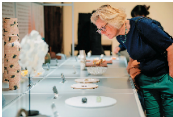
“中华美学源流——良渚文化与当代造物展”在米兰设计周主展会卫星展现场

本次展览获米兰市政府批准,由中国驻意大利大使馆、中国驻米兰总领事馆支持。是一次从学术研究到设计