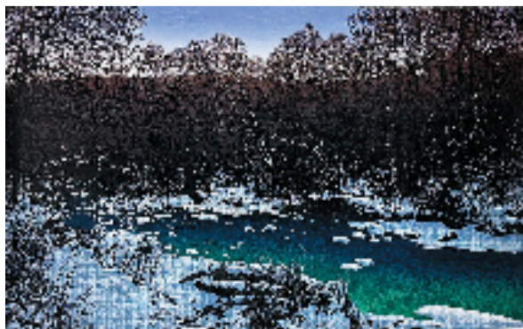
李军岩 故乡的冬汛 套色木刻

主办方希望此次展览能够赓续版画文脉,激发创作热情,让青春画笔描绘人生华章,让龙江版画绽放时代光芒。