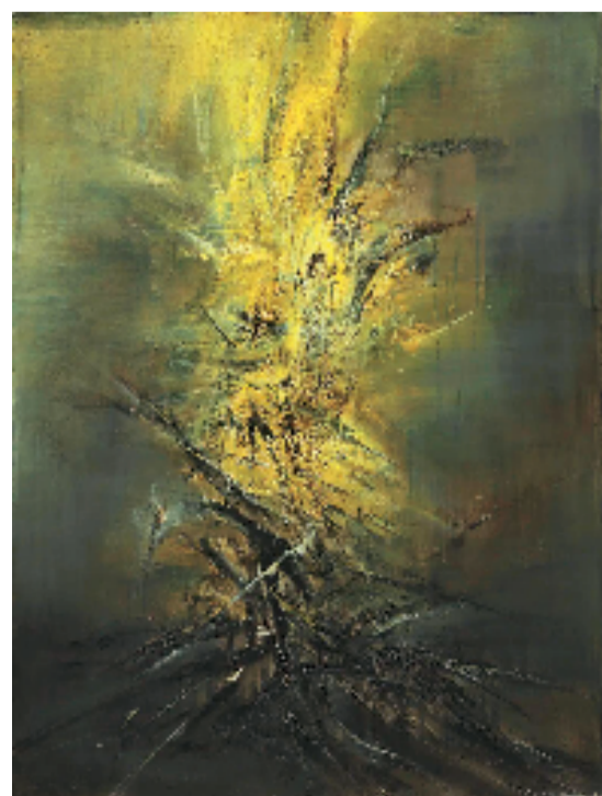
赵无极(1920-2013) 14.12.62 布面油画 1962年