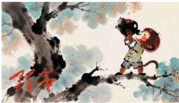
水墨AI“秒动画”工作坊 山水情新叙 动画作品(影像截图)