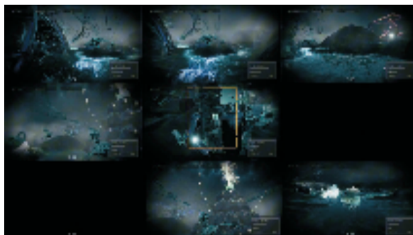
管子抒《氧境》2分41秒(影像截图) 2024年

是时代艺术演进中,中国绘画图示语言的新拓展,放眼长时段的艺术史脉络来看,它会不会是中国文人画的动态延展呢?