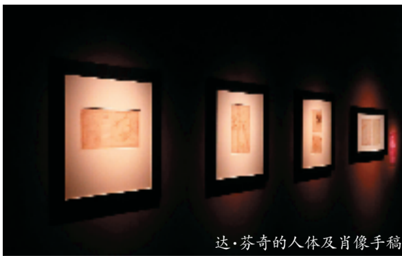
达·芬奇的人体及肖像手稿

展览分为两部分。“邂逅蒙娜丽莎”以莱奥纳多·达芬奇名作《蒙娜丽莎》为主轴。法国卢浮宫博物馆和大皇宫沉浸式展览馆特别为香港制作多媒体沉浸式体验,将这幅肖像画跨越五百多年的非凡经历编成六个章节,由蒙娜丽莎以“独白”形式,娓娓道来那抹神秘微笑背后引人入胜的故事。“文艺复兴的再现”汇聚由法国国家文艺复兴博物馆及意大利昂布罗修艺术博物馆等多家文博机构借出的包括绘画、版画、雕塑、工艺美术以至日常用器等艺术作品。大部分首度在香港展出,当中包括四张达·芬奇的珍贵手稿,以及多位文艺复兴时期艺术大师的作品,例如卢卡·彭