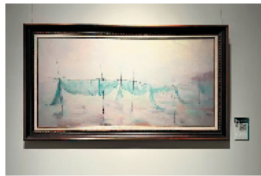
Artist1.0研发团队 潮汐的呼吸

本报讯 记者 叶玉跃 当江南的烟雨与人工智能的算法在画布上相遇,会呈现出怎么样全新的面貌?5月9日,由浙江大学主办的“印象江南——人工智能辅助创作(AIAC)油画展”在浙江大学校友企业总部经济园开幕。本次展览围绕江南水乡、古镇与自然景观等典型文化意象展开,探索人工智能如何在不可替代艺术家的前提下,拓展创作的边界,为公众打开一扇读懂AI与艺术共生的全新窗口。