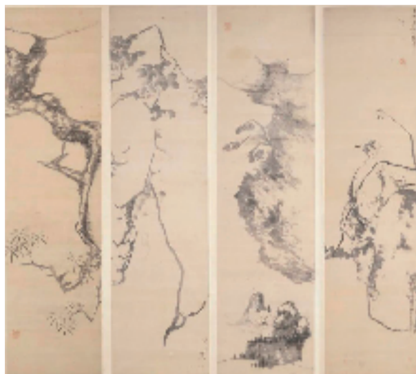
清代 八大山人 四条屏 161.8x42.2cmx4 中国画 上海博物馆藏

八大山人以笔墨传承文人风骨,主张以神写形、以意造境,不仅打破了传统壁垒,更为写意艺术的现代表达提供了诸多可能。尤其是其简练笔墨与空灵留白所营造的“极简美学”,也高度契合当代人对纯粹性、简约性的追求,为快节奏