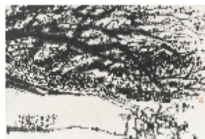
马锋辉 南浔小莲庄 32.5×48cm

心性相见——以真心对自然，心物坦诚，落笔有真诚。艺术的底色是真诚，写生的根基是本心。他始终以纯粹赤诚的艺术之心奔赴自然，与山川草木坦诚相对、与天地风物静静相融。唯有本心纯粹，方能观物真切，让笔下的一山一水、一草一木，拥有直击人心的温度与灵气。