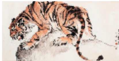
钟正山 虎年画虎 69×136cm 1974年

从早期探索新的南洋地方风格到创建具有现代性的水墨语言，钟正山的绘画技巧不断变化。他通过点、线、面重构现代水墨视觉体系，开拓出“异度空间”的时空叠印新范式，实现了传统水墨从具象到意象、再到半抽象的现代转型。