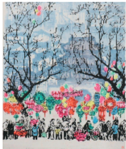
李树勤 春满人间 56×45.2cm 1963年

为清晰勾勒出水印木刻演进之路，主办方追本溯源、系统梳理，特策划本次展览，遴选馆藏精品百余件，辅以珍贵档案史料，全景再现水印木刻的崛起、嬗变与重构。在一代代创作者的不懈耕耘中，江苏水印木刻不仅从地域工艺跃升为当代