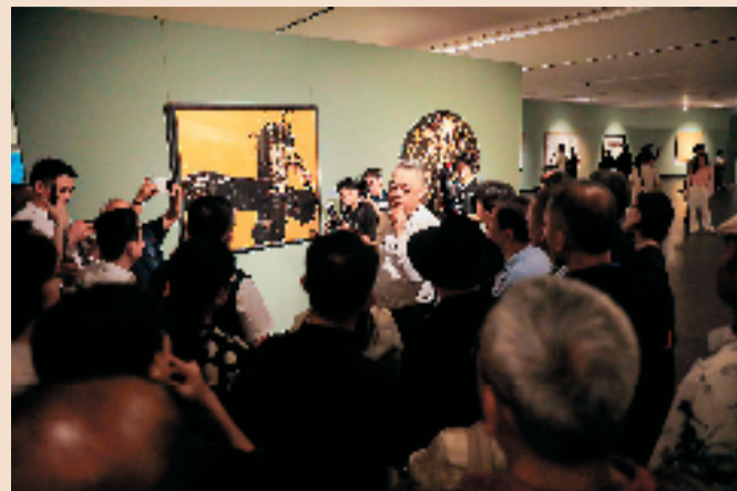
《书一切象》太原巡展展览现场