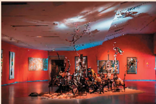
《书一切象》太原巡展展览现场