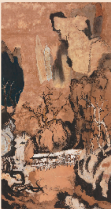
魏立刚 崖嶂藏屋图 180×97cm 墨、丙烯、宣纸