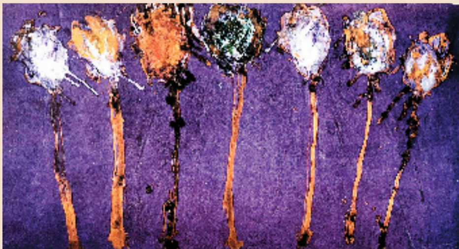
魏立刚 卉图 97×180cm 宣纸 墨 丙烯 漆