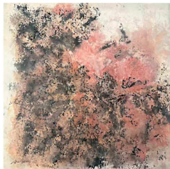
万修辰 如实知见 69x69cm

本报讯 通讯员 林晓峰 近日，万修辰“于相离相，乃往过去”个人作品展及专题艺术研讨活动在杭州国大恒庐美术馆开展。本次展览集中呈现艺术家现代彩墨精品力作，作品风格新锐独特，虚实相融、意境空灵，极具当代艺术辨识度与个人艺术特质。