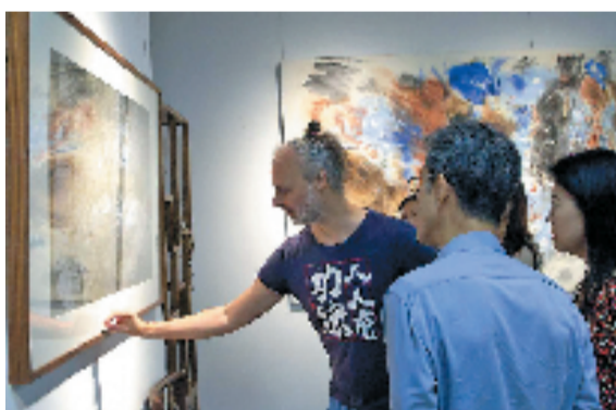
西班牙艺术家乐墨在为观众讲解作品

本次展览主题“道法自然”取自《道德经》，亦是乐墨本次创作的核心主旨。展品创作以中国传统书画材料为根基，主打宣纸与松烟墨，同时搭配流体丙烯等媒介，在材质上延续东方水墨脉络，在表现形式上吸纳西方抒情抽象艺术语言，整场作品东方气韵尤为浓厚。