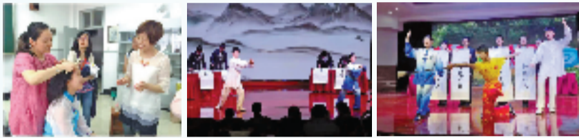
图1家长和师生精心编排“墨韵太极 文武同辉”文艺节目