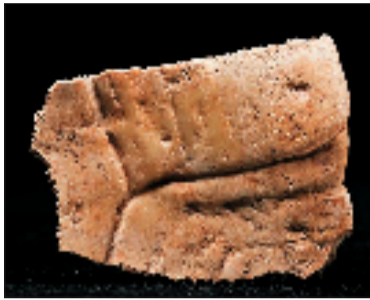
西周“秦人”卜甲 陕西省宝鸡市周原遗址出土 陕西省考古研究院藏

开幕式现场,陕西省文物局副局长王润泉,上海市文化和旅游局党组成员、副局长廖燕灵,甘肃省文物局二级巡视员白坚,上海市文化和旅游局党组成员、上海博物馆馆长褚晓波共同为展览揭幕。