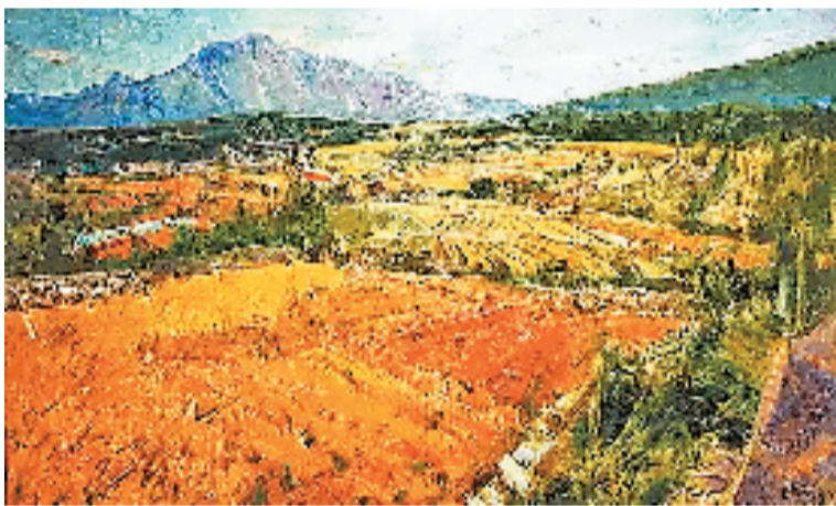
范迪安 中原夏收 80x140cm 油画 2026年

写生展”,在嵩山脚下的登封启动。30余位全国美术家与河南美术工作者齐聚中岳,开启扎根生活、礼赞山河的艺术之旅。这是一次致敬山河的写生之旅,更是一场对话历史的精神归程。画家们走进嵩阳书院、三皇寨、少室阙,体悟嵩山的雄浑壮美,触摸厚重底蕴,同时感受城市更