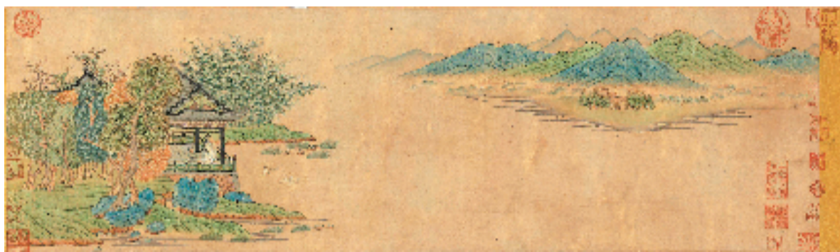
元 钱选 兰亭观鹅图 24.7×82.1cm 纸本设色 台北故宫博物院藏

可如今，这份珍贵的仪式感，被太多人抛在了脑后。办展览一味追求排场宏大，名家走秀、宾客云集；做作品