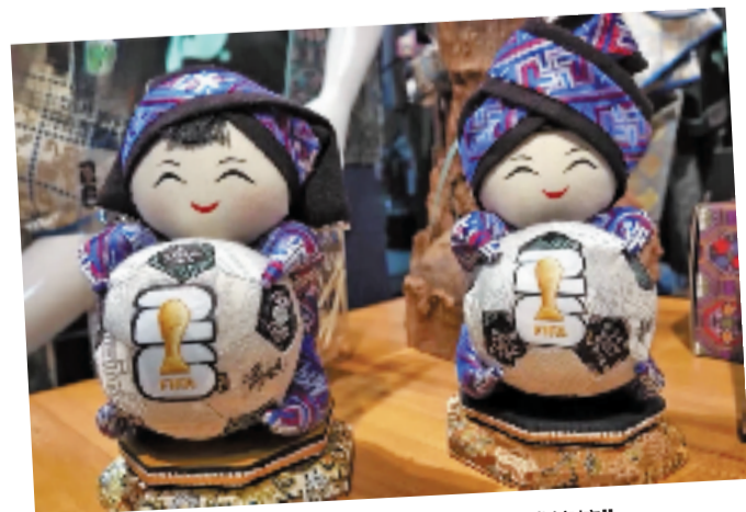
广西壮锦世界杯联动产品——“壮球孃孃”