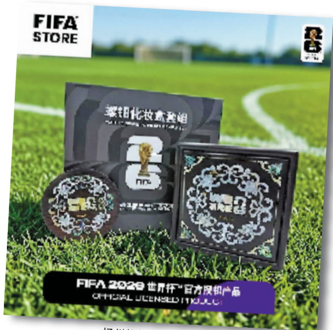
扬州螺钿镶嵌系列产品

潮玩让世界看到中国“当下”的活力,而非遗则用细腻深厚的工艺向世界传递了中国“传统”的厚度。“古”与“今”的交汇,让世界看到了更立体的中国。潮玩以年轻、活泼的姿态贴近世界,而非遗则用精致、从容的讲述展示中国。足球滚动向前,中华文化也在这场全球盛会中,以更加鲜活、从容的面貌奔向世界。