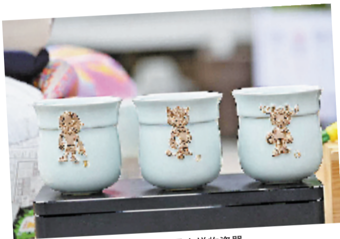
河南汝窑美加墨吉祥物瓷器